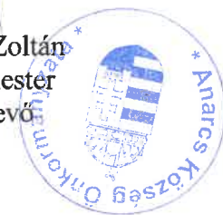
Kertész Zoltán polgármester eskütevő