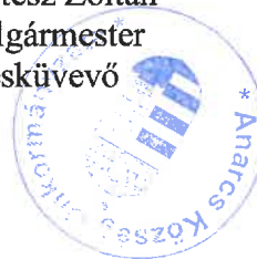
Kertész Zoltán polgármester eskütevő